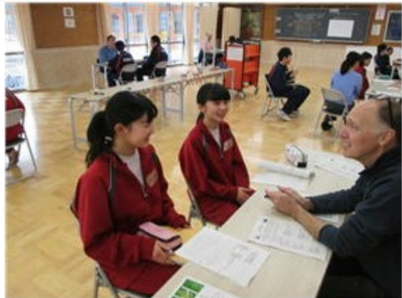
笑顔で英会話をする1年生

沼田中学校は平成26年度から29年度までの4年間、文部科学省から「英語教育強化地域拠点事業」という指定を受けて、これからの英語教育のモデル校として研究に取り組みました。英会話サーキットもその中の一つです。8人のALTの先生と生徒二人のペアで英会話をする授業です。笑顔でとても楽しそうに英会話の授業に取り組んでいました。ALTの先生からは「1年生たちも確実に力を付けています」という評価をいただきました。研究の成果はとても大きかったようです。