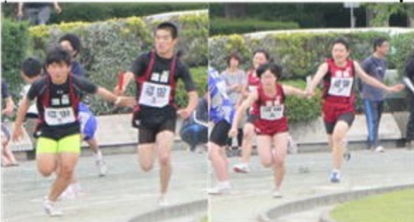
昨年度の男女リレーのようす