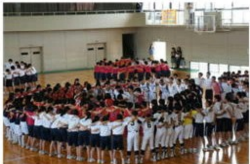
「心一つに」～全校で組んだ円陣

沼田中学校総合体育大会壮行会が生徒会の主催により実施されました。各部の部長の決意表明に続き、345名の生徒が円陣を組み一つになって勝利を祈願しました。応援歌「大空高く」も大きな声で合唱しました。沼田中学校では教育部活を目指し、勝利だけでなく、礼儀や感謝、協力等の大切さを実感することを重視しています。保護者の方々にも教育部活を意識していただきながら応援いただきますようよろしくお願いいたします。