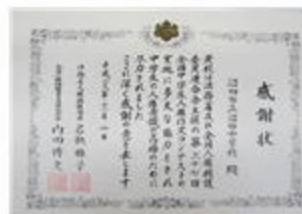
法務省よりいただいた感謝状

先日、法務省より感謝状をいただきました。本校では長年にわたり、全校をあげて全国中学生人権作文コンテストに参加してきました。その成果が今回認められ、法務省及び全国人権擁護委員連合会から感謝状が贈られました。生徒玄関に飾っておきますので、来校した折には、どうぞご覧になっていただければと思います。