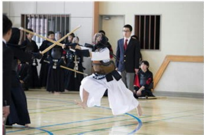
沼田市中体連春季大会～剣道決勝