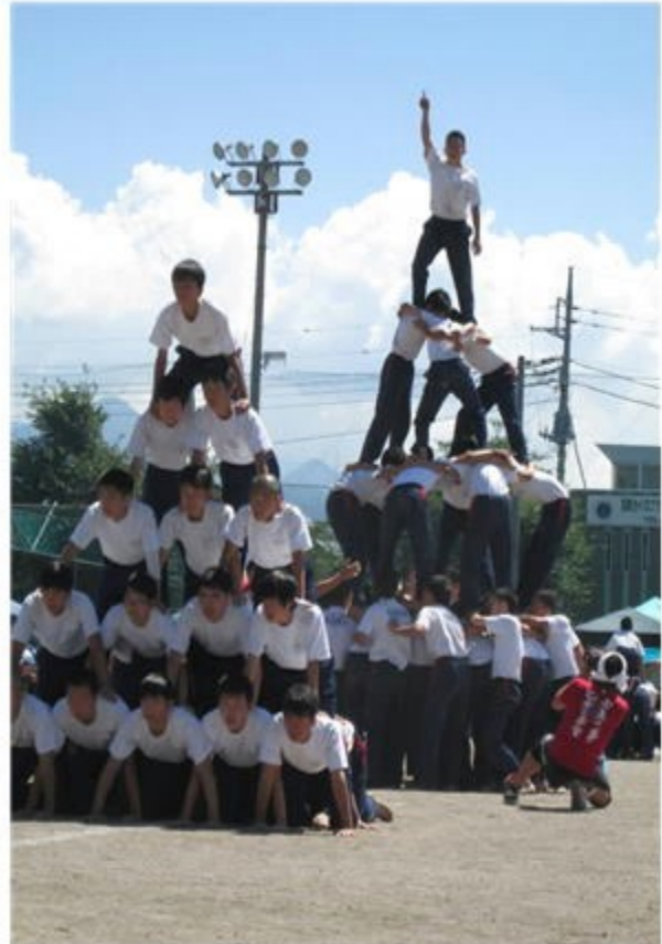
全校男子 組み立て