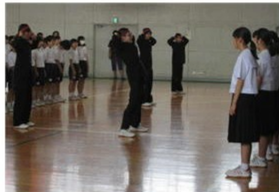
～エールを送る応援団～

生徒会本部の呼びかけで有志20名からなる応援団が結成され、代表選手にエールを送りました。昼休みを利用し、何度も練習を重ねて素晴らしい応援をしてくれました。全校生徒も応援団リードのもと、沼中応援歌で選手を激励しました。その甲斐あって、裏面のように立派な成績を残すことができました。紹介します。