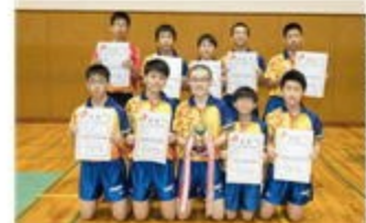
県優勝した男子卓球部