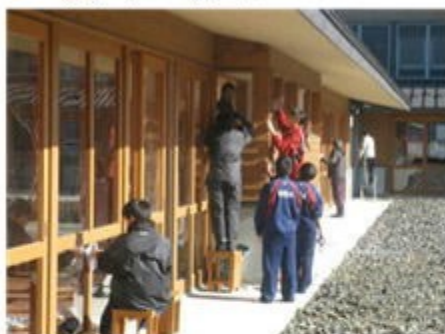
心を磨く生徒たち

生徒、地域ボランティア、PTA会員総勢約150名が参加し、校内ボランティア活動が実施されました。開会行事で校長先生からは「校舎とともに自分の心も磨けるといいですね」というお話がありました。作業は、校舎内のガラスふきと教室の梁の埃取りを行いました。約2時間の活動でしたが、おかげさまで大変きれいになりました。調理ボランティアの方々には、豚汁を作ってください、作業終了後においしくいただきました。閉会行事で生徒から「自分の意思で参加した。きれいになって気持ちよかったです!」「ガラスを磨きながら自分の心も磨くことができました!」「豚汁がとってもおいしかった!」等々の感想がありました。帰る際には、中澤コーディネーターさんからの大根のお土産もあり、参加者は皆笑顔で帰宅していきました。