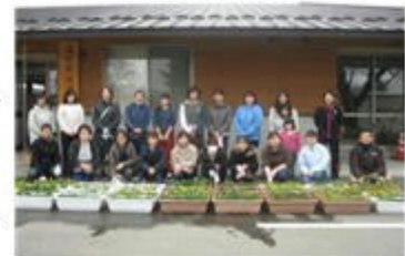
作業を終えた母親委員の皆さん

PTA母親委員会の皆さんにより、春に引き続き、秋の花植え作業が実施されました。プランターに色とりどりのピオラ、パンジーを植えたり、玄関前に飾ったりしていただきました。おかげさまで、本校では、一年中花に囲まれて生活することができます。美しい環境のもとで学習すると学力も付きやすいという研究もあるようです。とても恵まれた環境の中で生徒たちが気持ちよく学校生活を送ることができます。大変ありがとうございました。