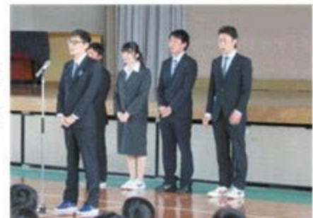
初日、全校生徒に挨拶

今年度もかつて沼中生だった5人の大学生が教育実習生として沼中に帰って来ました。先生になるために「自ら考え」「進んで」「真剣に」「一生懸命」生徒と接しています。どうか温かい目で見守っていただけるようお願いいたします。