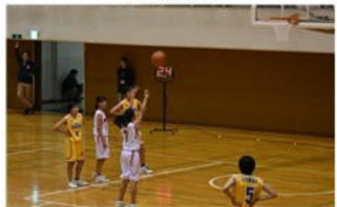
女子バスケット部