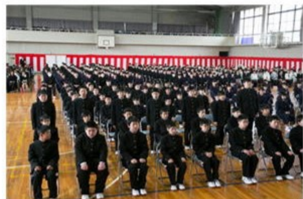
新入生呼名のようす

新入生111名を迎え、2年生105名、3年生129名の総勢345名で新年度をスタートしました。校長先生から人の役に立っているという「自己有用感」を感じられるよう頑張りましょうという話をいただきました。