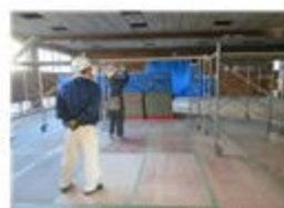
工事の始まった柔道場

12月18日より武道場改修工事が始まりました。屋根や天井の補修、ガラス交換等を中心とする工事です。工期は3月中旬までとなっています。近くを通る生徒の安全には十分配慮して工事を進めるよう業者をお願いしました。また、2月からは足場を組んでの作業となるため、武道場の北側、東側通路が通行不可となります。ご承知おきください。