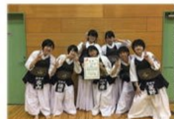
敢闘賞をいただいた女子剣道部