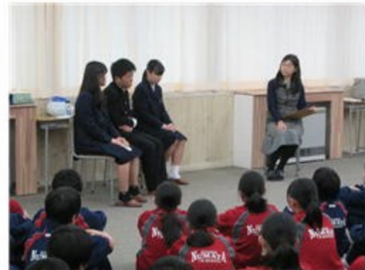
高校について語る卒業生

1、2年生が参加し、先輩の貴重な話を聞くことができました。話を聞いた1、2年生の感想は「中学校とは違うことがたくさんあってびっくりしました。高校生になるのが楽しみになりました。高校についてもっと深く考えていきたいと思いました。これからたくさん勉強して入りたい高校に入れるといいです。」でした。