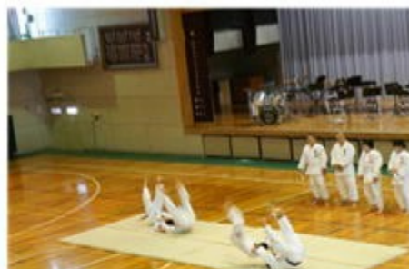
部活動紹介のようす～柔道部

沼田中学校には生徒会本部を含め、11の委員会があります。各委員長さんから活動内容や活動目標などについて1年生に説明がありました。また、13の部活動の部長さんたちからも各部の特徴や目標、練習方法などについて部員たちの実演を示しながらわかりやすい説明がありました。部活動は3年間続けるものですので部活動見学、部活動体験を通して慎重に決定してほしいと思います。中学校生活の大切な活動を先輩たちが一生懸命工夫して教えてくれた歓迎会となりました。