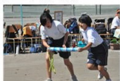
3年生 みんなで飛ぶ翔りリレー