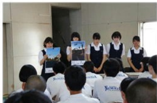
In America, we call the road "Avenue"

3年生全員と沼田女子高校2、3年生19名とが英語の授業で交流しました。沼田女子高校の生徒が4班にわかれ、アメリカ・カルフォルニアでの一ヶ月間のホームステイ経験をスピーチしてくれました。沼中生はクラスごとに沼女生のスピーチを聴いて英語で質問したり、感想を言ったりしました。英語での会話を楽しみながら交流できました。秋には、県内中学校英語教師を対象にした新しい英語授業の発表会が本校で行われます。