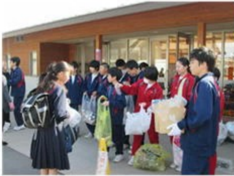
ボランティア活動の朝～玄関前にて

今年は朝登校しながら、ボランティア活動として通学路のゴミ拾いを実施しました。近所の方々と元気にあいさつを交わしながら地域の清掃活動を通して、奉仕の精神、郷土を愛する意識を高められたらと思います。活動した生徒の感想を紹介します。