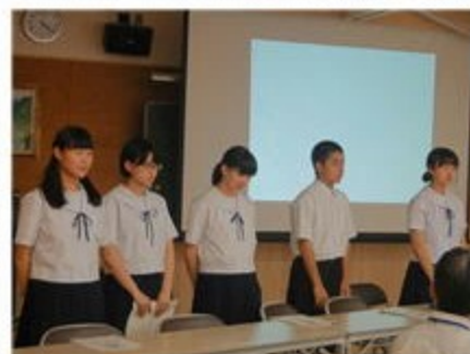
生徒保健委員会の発表のようす

【お詫びと訂正】沼中だよりNo.4において、郡市陸上競技大会の記録に間違いがあり申し訳ありませんでした。お詫びし