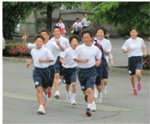
「毎朝の風景」～朝ランに挑戦する生徒たち

明日から35日間の夏季休業が始まります。この休みを利用して、普段出来ないこと（1学期の総復習、2学期の予習、体験学習、家の手伝い、家族旅行など）にチャレンジしてほしいと思います。また、3年生は希望進路実現のため、1・2年生は2学期の学習の準備や部活動（新人戦等）での目標達成のための大切な期間として夏休みを過ごすことも大変重要です。県大会、関東大会、全国大会となかなか予定を立てることが難しい生徒もいるとは思いますが、ステップアップスクール等を活用し、計画的に生活できるよう家庭での声掛けもよろしくお願いいたします。