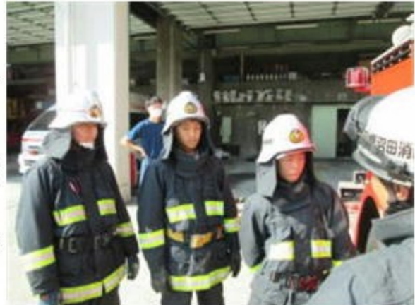
利根沼田広域消防本部

沼田市内32の事業所にお世話になり、今年度も2年生を対象に職場体験学習が行われました。3日間という日数は通常業務をしている各事業所にとってはとても負担が大きいとは思いますが、快く受け入れを承諾していただきました。生徒たちはそれぞれの職場で、業務内容をこなしながら、大変貴重な体験をさせていただきました。わずか3日間でしたが、大きな成長が見られたように思われます。今回の体験を通して、仕事をする大変さ、姿勢やあいさつなどの基本的なこと、働くことの意義、やりがいなどを学ぶことができ、将来の進路選択に大いに役立てることができると思います。また、中学校生活にもこの体験を生かすことで、沼田中での生活をより充実したものにしてほしいと思います。ご家庭においてもこの機会に、将来の進路選択について、話し合っていたいただくと幸いです。以下にお世話になった事業所を紹介します。来年度も数多くの事業所にお世話になればと思いますので、受け入れが可能な事業所がありましたら、是非、ご紹介ください。