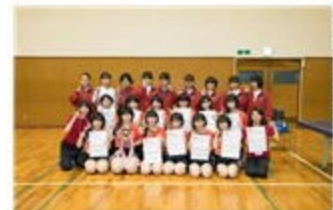
県優勝した女子卓球部