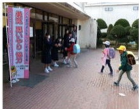
あいさつ運動～小学校にて

また、沼中学区の小学校に朝のあいさつをしに出かけています。東小、北小とあいさつでも連携を深め、沼中学区全体がますます笑顔あふれる地域になることを願っています。