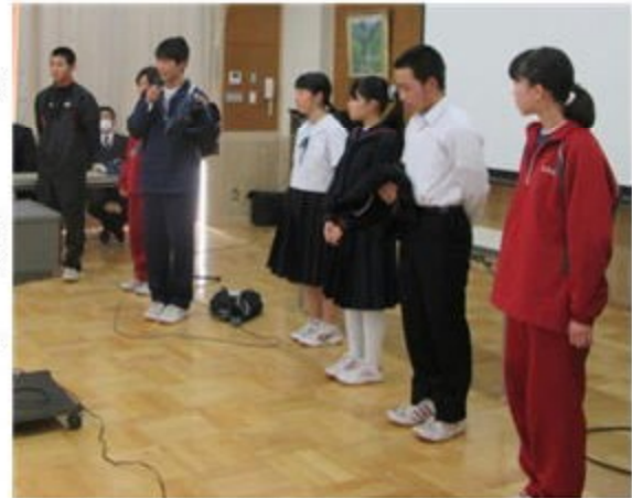
制服、体育着等について説明する本部役員

入学予定者数は108名(特支学級6名を含む)で、来年度の1年生は3クラスになる予定です。