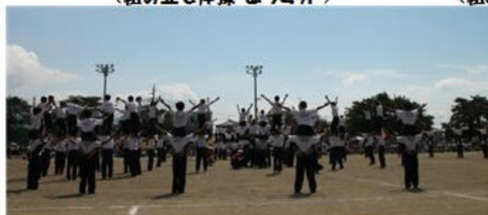
〈組み立て体操・花園〉