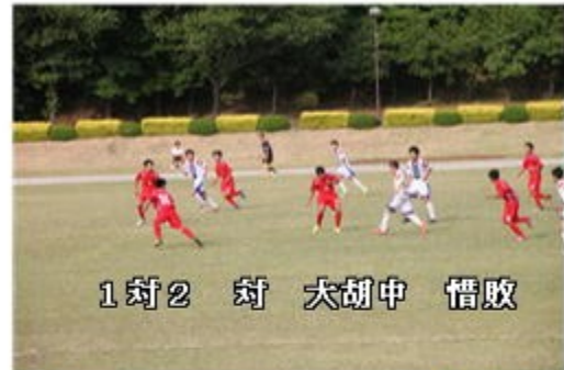
1対2 対 大胡中 惜敗