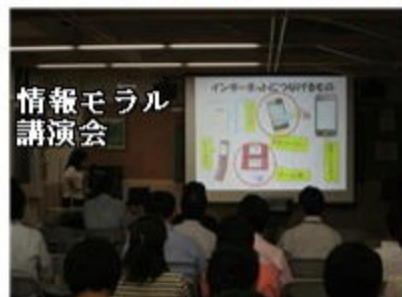
情報モラル 講演会