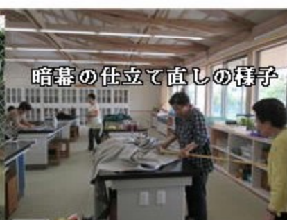
暗幕の仕立て直しの様子