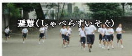
避難(しゃべらずいそぐ)