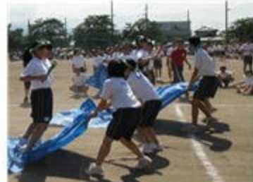
〈みんな輝け！挑戦リレー〉