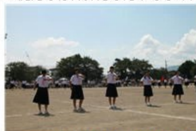
〈女子ダンス・年下の男子、おいでシャンプー〉

男子全員による騎馬戦、女子全員による棒引きでは、それぞれ迫力ある戦いを見せてくれました。生徒たちは自分たちだけでなく、多くの観客を楽しませてくれました。