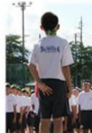
〈実行委員長あいさつ〉