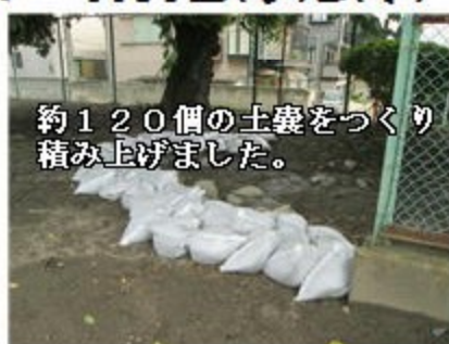
約120個の土嚢をつくり 積み上げました。

1日(水)に校庭整地のための土嚢づくり、図書ボランティア、2日(木)に理科室の暗幕づくりをお世話になりました。土嚢は吸水口に土まで流れることを防止するためです。暗幕は、旧校舎で使用していた物を新校舎用に仕立て直していただき、費用が節約できました。ありがとうございました。