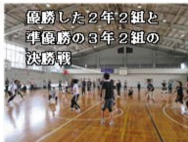
優勝した2年2組と準優勝の3年2組の決勝戦

恒例になりましたPTA球技大会が実施されました。お陰様で大きな怪我もなく、好プレーあり珍プレーありで楽しい時間を過ごすことができました。たくさんの方のご参加ありがとうございました。