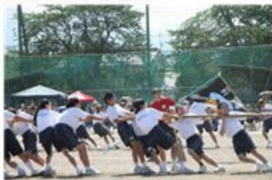
〈絆を深めろ！みんなで本気引き〉

学年種目は、1年生が「絆を深めろ！みんなで本気引き（綱引き）」2年生が「玉入れ」3年生が「みんな輝け！挑戦リレー」を行いました。生徒たちが自分で考え、計画、運営を行い、どの学年も学級みんなで力を合わせ、競技だけでなく、仲間への声援を熱心に送っていました。生徒会種目、学年種目、徒競走と入場行進の結果を合わせた学級対抗は、それぞれ、1年3組、2年3組、3年1組が優勝しました。