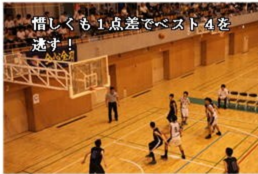
惜しくも1点差でベスト4を逃す!