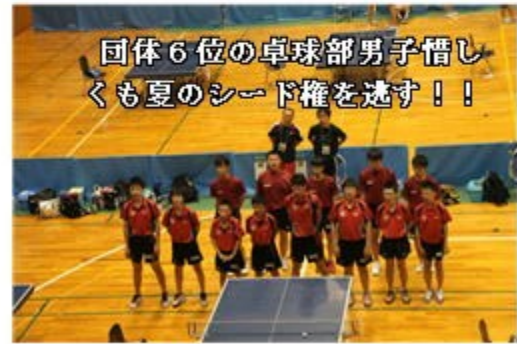
団体6位の卓球部男子惜しくも夏のシード権を逃す!!