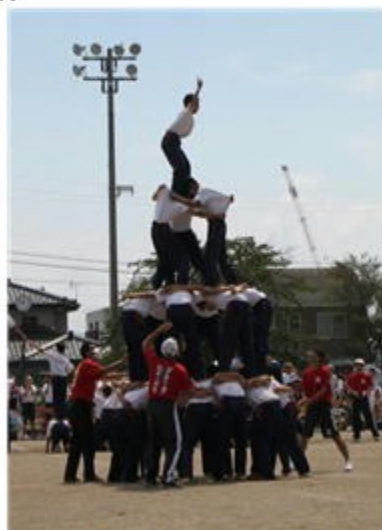
〈組み立て体操・四重の塔〉