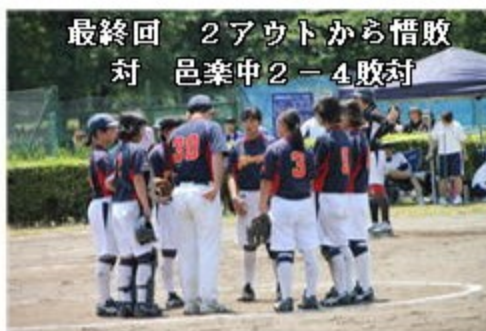
最終回 2アウトから惜敗 対 邑楽中 2-4敗封