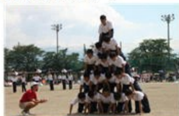
〈組み立て体操・ピラミッド〉